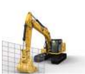
PROTECCIÓN ELECTRÓNICA AL FRENTE (E-WALL FORWARD)