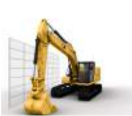
GIROS CON PROTECCIÓN E-WALL