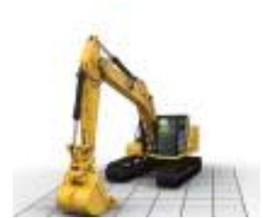
PROTECCIÓN ELECTRÓNICA HACIA ABAJO (E-WALL FLOOR)