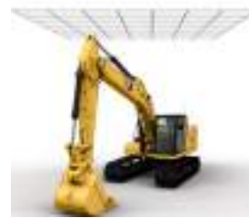
TECHO CON PROTECCIÓN E-WALL