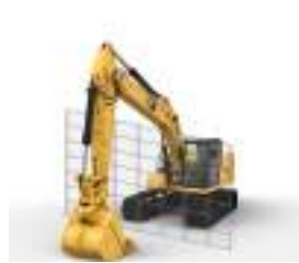
PROTECCIÓN ELECTRÓNICA PARA LA CABINA (E-WALL CAB PROTECTION)